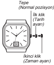
Saatinizin şekli resimde gösterilenden farklı olabilir.