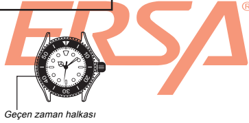
Geçen zaman halkası